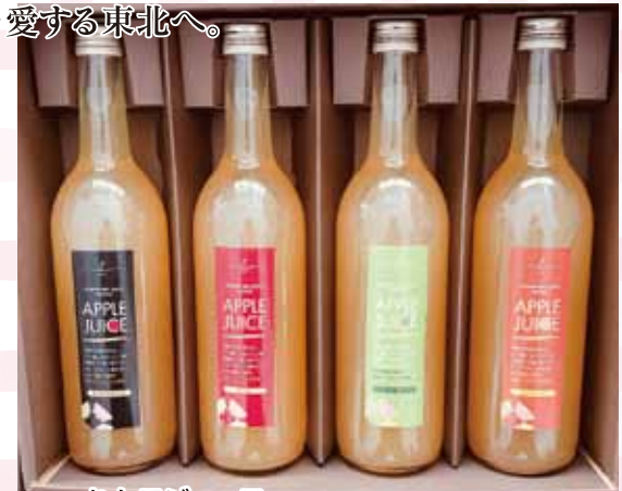
りんごジュース オリジナルブレンド・ジョナ・サンふじ・王林 (1本・720ml) 各 800 円