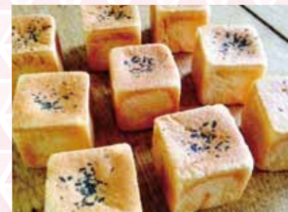
くるみとゴマのあんキューブ