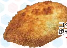
コクと旨みの 焼きカレー 120円