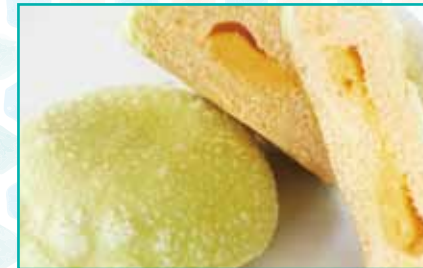
夕張メロンパン 150円

当店は注文販売をメインとして販売しております。注文販売対応可能日 火曜日PM~土曜日PMまで その他パンの種類などについてはお電話でお問い合わせいただければと思います。