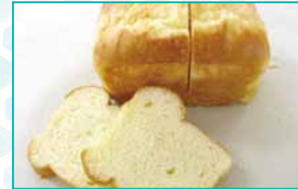
塩麹バターブレッド 200円