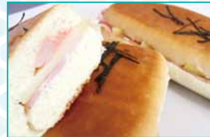
明太マヨポテトパニーニ 180円