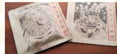
津軽お化け珈琲ドリップ (8g) 各 100円