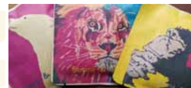
アニマルコーヒー (8g) 各 100円