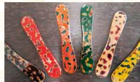
津軽塗アイスヘラ (1本) 各 800円