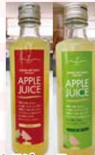
りんごジュース サンふじ・王林 (1本・275ml) 各 300 円