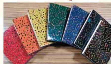
津軽塗御朱印帳 (1冊) 各 5,000円