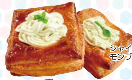
シャインマスカットの モンブラン 180円

ノフクマルシェ開催期間以外でも、各事業所で販売をしています。掲載の価格は消費税込です。