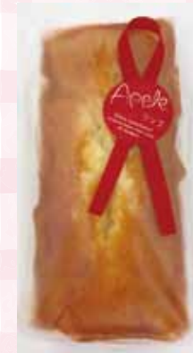
アップルパウンドケーキ (180g) 500 円