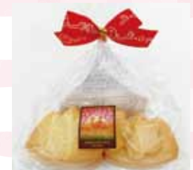
岩木山クッキー (30g) 120 円