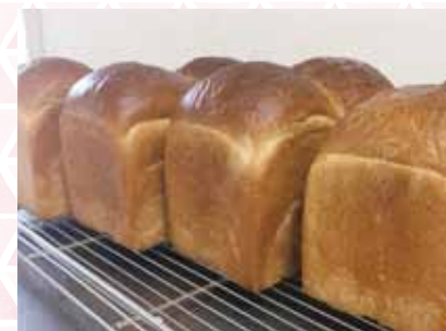
ゆいまある山型食パン