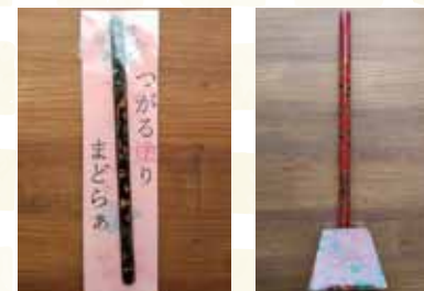
津軽塗マドラー 津軽塗鉛筆 (1本) 900円 (1本) 800円