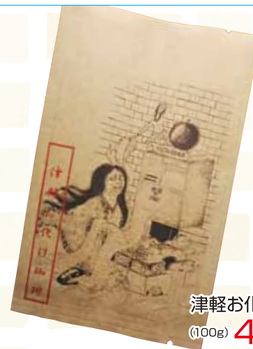
津軽お化け珈琲 (100g) 400円

ノウフクマルシェ開催期間以外でも、各事業所で販売をしております。掲載の価格は消費税込です。