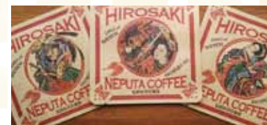
弘前ねぶた珈琲 (8g) 各 150円